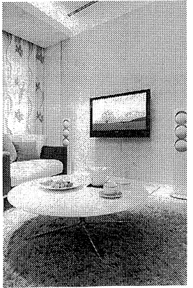
汚れがつきにくく、ふき取りやすい織物壁紙の施工例